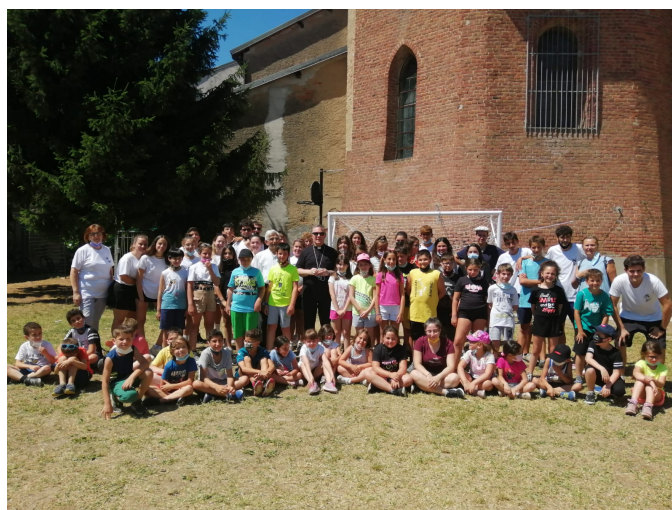
Visita del vescovo all'estate ragazzi 2021