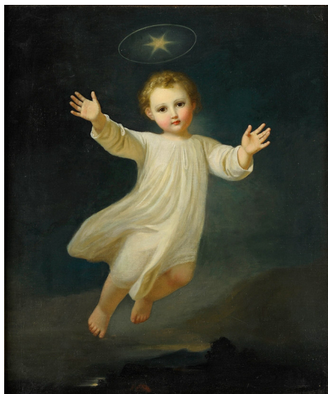
Melchior Paul von Deschwenden, Das Christuskind , 1880 c.a.

Inauguriamo questa rubrica con l'affascinante percorso che unisce l'arte e la fede, in cui Gesù viene ritratto come un bambino; innumerevoli sono le tele, gli affreschi, i mosaici o le sculture che traducono in immagini visi-