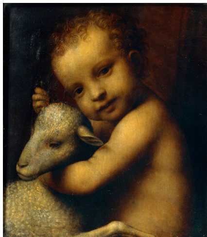
Bernardino Luini, Gesù Bambino con agnello, 1525. L'immagine colpisce per la dolcezza, e l'umanità del Gesù Bambino.

Con l'avvicinarsi del Natale abbiamo pensato di utilizzare questo spazio per offrire una riflessione legata al mondo dell'arte, in particolar modo all'immagine di Gesù Bambino. Queste poche righe vogliono però essere solamente un breve assaggio di un percorso più dettagliato e puntuale che sarà possibile leggere, ma soprattutto osservare, sul sito internet www.villaviva.it .