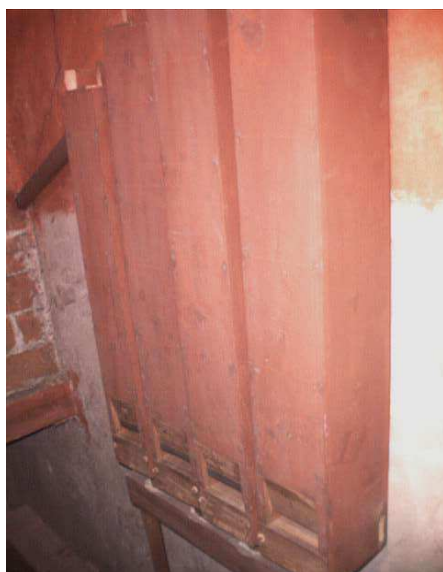
Canne in legno

L'organo di Villanova è un tipico organo costruito secondo gli schemi dell'organaria ottocentesca italiana. E' dotato di 1732 canne di cui 1658 in lega di piombo e stagno e per alcuni registri solo in stagno; le rimanenti 74 sono costruite in legno. Il numero complessivo di canne è composto da 1489 ad anima e da 243 ad ancia.