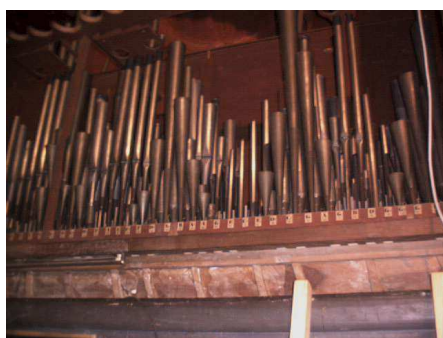
Canne poste dietro la facciata

Le canne di legno sono disposte lungo la parte posteriore e laterale dell'organo; 47 di esse