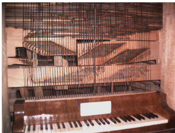
Console dell'organo della Parrocchiale di Sant'Emiliano con vista della catenacciatura meccanica.