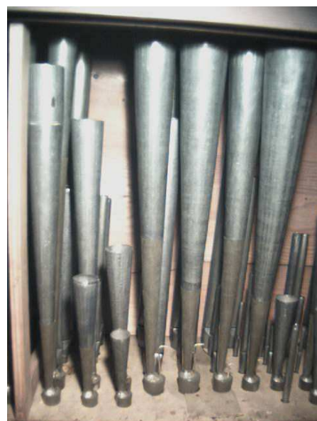
Canne racchiuse nella "cassa armonica"

Il suono è prodotto in due diversi modi: mediante la semplice vibrazione dell'aria nelle cosiddette canne ad anima e con la vibrazione di una linguetta di