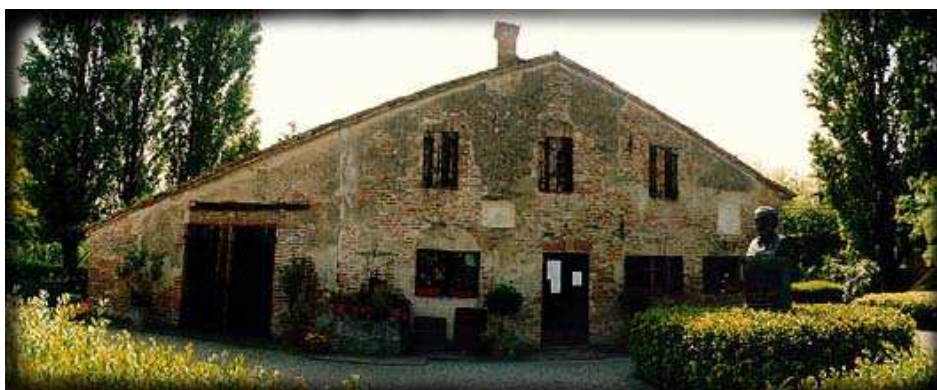
La casa natale a Le Roncole di Busseto

L'impresario del massimo teatro milanese, Bartolomeo Merelli, gli offerse un contratto per altre due partiture: Un giorno di regno ( Il finto Stanislao ), opera buffa,