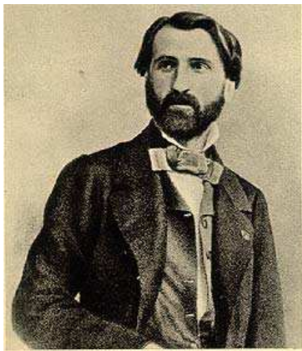
1842- Giuseppe Verdi al tempo della composizione del Nabucodonosor

ebbe una sola rappresentazione (5 settembre 1840), e solo con Nabucco , la cui prima ebbe luogo il 9 marzo 1842, il talento verdiano si rivelò appieno. Il modello dello spettacolo grandioso, dove la vicenda È disegnata a grandi tinte, si ripete nell'opera successiva, I lombardi alla prima crociata (Milano, Scala, 11 febbraio 1843); ed È con Ernani (Venezia, La Fenice, 9 marzo 1844) che l'esperienza drammatica si concretizza nel conflitto tra le passioni dei personaggi. Questa scelta stilistica prosegue con I due Foscari (Roma, Teatro Argentina, 3 novembre 1844), ed È ulteriormente raffinata in Alzira (Napoli, San Carlo, 12 agosto 1845). Tutte le opere della prima fase creativa verdiana si differenziano fra loro perchè in ciascuna di esse viene esplorato questo o quel particolare aspetto dell'esperienza drammatico-musicale. Così, in Giovanna d'Arco , dalla tragedia di Schiller (Milano, Scala, 15 febbraio 1845), l'elemento soprannaturale gioca un ruolo determinante